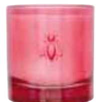
Fleur du levant Mûres, de fleur de cerisier, patchouli... Blackberry, cherry blossom, patchouli...

6449 07 H : 9,4 cm / ø : 8,1 cm packed by 1