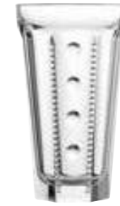
Long drink perles

6391 01 H : 14,5 cm ø : 8,44 cm Cl : 34,8 Oz : 12,28 1 768