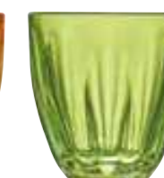
Gobelet kiwi 6144 14 25 Cl