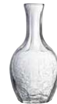
75 cl 5143 01 H : 22 cm Oz : 26,5