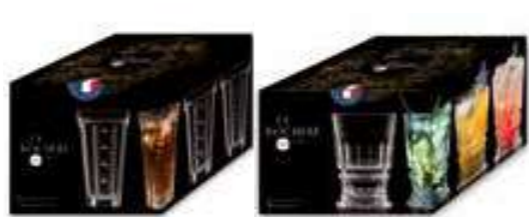
Saga Set de 4 long drink 2 motifs différents

6447 01 H : 15,9 cm / ø : 8,9 cm Cl : 42 / Oz : 14,8 4 360