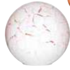
Luminaire à poser orange 4481 36 H : 21,5 cm / ø : 23 cm Fil orange Lampe E14 5W MAX