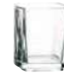
Mise en bouche 2

6227 01 H : 5,2 cm Cl : 5 / Oz : 1,8 6 5130