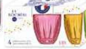
NEW Lily Set de 4 gobelets couleurs Design Christian Ghion

6338 96S4 H : 8,2 cm / ø : 7,8 cm Cl : 23 / Oz : 8,11 1248