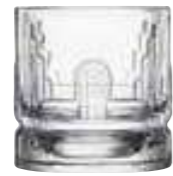
Verre à whisky John

6429 01 H : 9 cm / ø : 8,6 cm Cl : 30 / Oz : 10,58 6 1368