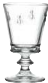
Verre à vin

6110 01 H : 14,1 cm / ø : 8,5 cm Cl : 24 / Oz : 8,5 6 768