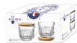
Set 2 tasses avec couvercles bois 646601 25 Cl