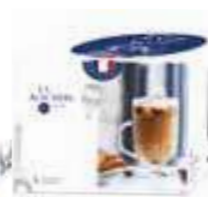
Mug Design La Racine

6435 01 H : 5,5 cm ø : 7,3 cm Cl : 10 / Oz : 3,53 6 1890