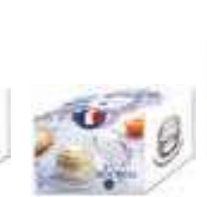
Versailles (1 coupelle, 1 cloche)

6402 01 H : 6,5 cm ø : 9,5 cm Cl : 7 / Oz : 2,47 1155