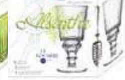
Set Absinthe 2 verres, 1 cuillère + 1 livret de cocktails

6144 96S4 H : 9 cm / ø : 8,6 cm Cl : 25 / Oz : 8,82 312