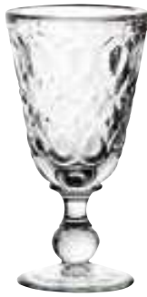
Verre à vin

6317 01 H : 16,5 cm / ø : 8,5 cm Cl : 23 / Oz : 8,1 6 672