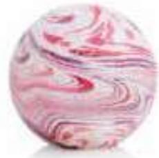
Luminaire Mandala 1 4481 11 H : 21,5 cm / ø : 23 cm Fil blanc Lampe E14 5W MAX