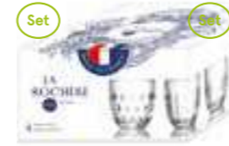
Troquet Set de 4 gobelets 4 motifs différents

6415 01 H : 8,2 cm / ø : 7,8 cm Cl : 23 / Oz : 8,11 364