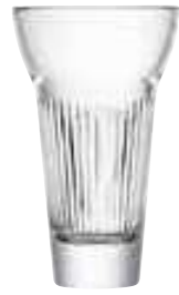
Verre à pastis MARIUS

6462 01 H : 13,4 cm ø : 8,1 cm Cl : 22 / Oz : 7,76 6.90LR2.80 6 768