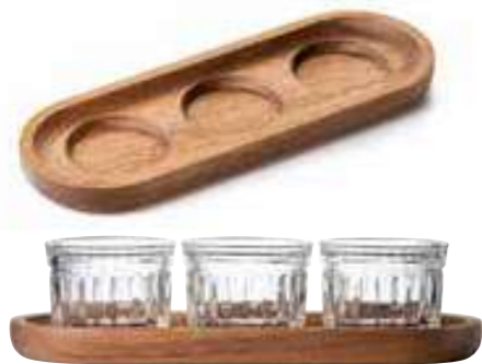
Set Délice 3 verrines Délice 10 cl Design Studio LA RACINE

6438 01 H : 6,8 cm / ø : 7,03 cm Cl : 10 / Oz : 3,53 vendu en coffret couleur 1210 Plateau bois Long. : 25 cm Larg. : 9 cm Ép. : 2 cm