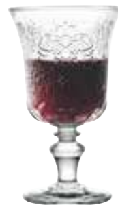
Verre à pied

6051 01 H : 15,4 cm / ø : 9,2 cm Cl : 26 / Oz : 9,17 6 672