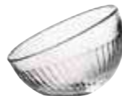
Coupe 6416 01 13 Cl