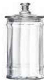
Bocal 1l vénitien large 4162 01VL H : 24,5 cm / ø : 11,5 cm Cl : 100 / Oz : 35,3