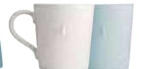
Mug céramique écru ou bleu (packed by 2 pcs) 5974 20/63 52 Cl