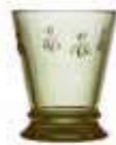
Gobelet olive* 6121 97