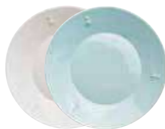
Assiette à dessert écru

5981 20 bleu 5981 63 < ø : 21,4 cm 4 760