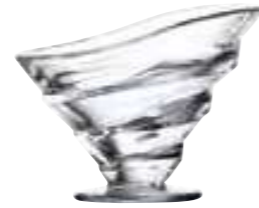
Circée basse 6314 01 H : 10,7 cm / ø : 14,1 cm Cl : 25 / Oz : 8,82 6 6 468