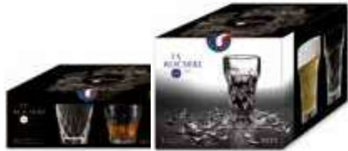
Gobelet Silex Design Benoît & Rachel Convers

6454 01 H : 9,3 cm / ø : 9,2 cm Cl : 30 / Oz : 10,58 6 1152