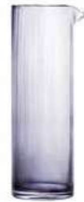
Broc vénitien fin*

5289 04VF H : 26,4 cm ø : 8,4 cm Cl : 100 Oz : 35,27