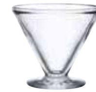
Coupe grand modèle 6327 01 H : 9,3 cm Cl : 22,5 / Oz : 7,74 6 6 720