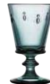
Verre à vin*

6110 48 H : 14,1 cm / ø : 8,5 cm Cl : 24 / Oz : 8,5 6 768