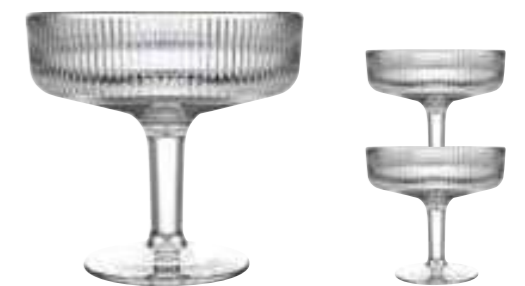
Coupe 6469 01 33 Cl