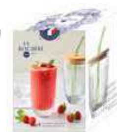
NEWS Smoothie 6465 01 45 Cl