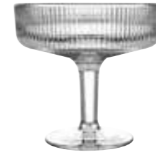
Coupe² 6469 01 H : 12 cm / ø : 12,6 cm Cl : 33 / Oz : 11,64 6 6 540