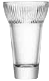
Verre à pastis FANNY

6462 01 H : 13,4 cm ø : 8,1 cm Cl : 22 / Oz : 7,76 6.90LR2.80 6 768