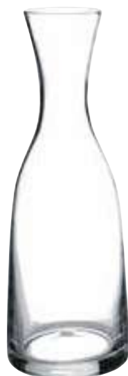
Carafe 100 cl

5170 01 H : 28 cm Oz : 35,3 soufflé bouche / hand made 6 270