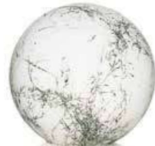
Luminaire ALBATRE grand format blanc 1 4141 62 H : 30 cm Fil blanc Lampe E14 5W MAX