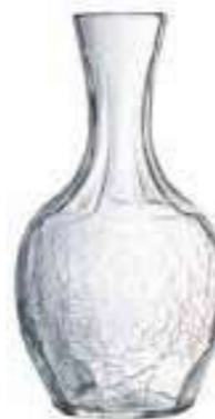
Carafe 100 cl 5145 01 H : 23,5 cm Oz : 35,3