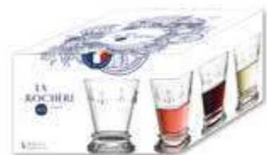
Set de 4 gobelets

6079 01 H : 6,4 cm / ø : 5,3 cm Cl : 6 / Oz : 2,1 6 2520