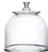
Bocal petit modèle 4581 01 H : 15,5 cm / ø : 17,6 cm Cl : 235 / Oz : 82,9