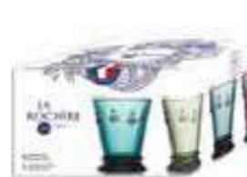
Set de 4 gobelets 4 couleurs assorties 6121 9654