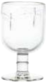
Verre à eau

6324 01 H : 13,5 cm / ø : 7,5 cm Cl : 28 / Oz : 9,9 6 768