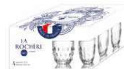
Set de 4 gobelets assortis

6409 01 H : 8,2 cm / ø : 7,8 cm Cl : 23 / Oz : 8,11 6 1152