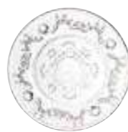
Assiette à pain