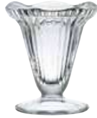
Cadette 6019 01 H : 12 cm / ø : 9,5 cm Cl : 20 / Oz : 7,5 6 6 660