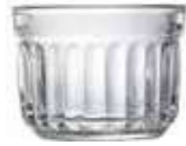
Verrine grand modèle

6419 01 H : 6,2 cm / ø : 8,3 cm Cl : 17 / Oz : 6 6 1536