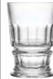
Verre à cocktail

6336 01 H : 12,75 cm ø : 9 cm Cl : 37 / Oz : 13 4 768