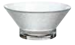
Coupe² 6287 01 H : 6 cm / ø : 7,8 cm Cl : 25 / Oz : 8,8 6 6 1026

*teinté masse/ Solid color * empilable / stackable