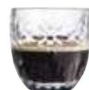
Tasse espresso fleurs

6375 01 H : 6,3 cm / ø : 6,2 cm Cl : 10 / Oz : 3,53 6 2784