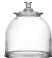
Bocal moyen modèle 4585 01 H : 16,5 cm / ø : 21 cm Cl : 385 / Oz : 135,8