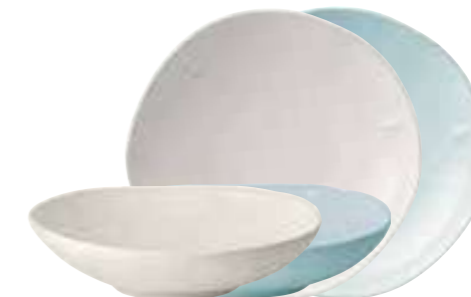
Assiette à dessert céramique bleu (packed by 4 pcs) 5981 63