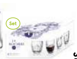
Troquet Set 4 espresso 4 motifs différents

6434 01 H : 12,9 cm ø : 7,85 cm Cl : 30 / Oz : 10,58 4 960