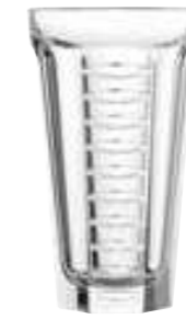
Long drink amande

6454 01 H : 9,3 cm ø : 9,2 cm Cl : 30 Oz : 10,58 1 1152