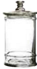
1l 4162 01 H : 24,5 cm / ø : 11,5 cm Cl : 100 / Oz : 35,3