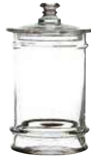
2l 4163 01 H : 27 cm / ø : 13,5 cm Cl : 200 / Oz : 70,5