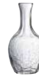
25 cl 5113 01 H : 15,7 cm Oz : 8,8