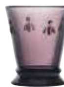
Gobelet Aubergine* 6121 08