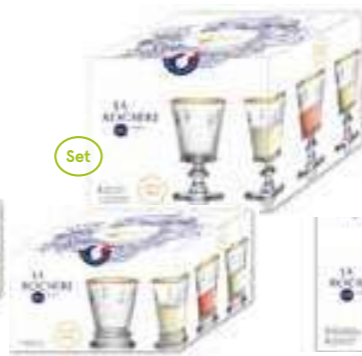
NEW Set de 4 gobelets bord or gold edition

6121 01S4 H : 10,3 / ø : 8,4 cm Cl : 26 / Oz : 9,2 240