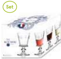
Set de 4 verres à vin

6110 01S4 H : 14,1 cm / ø : 8,5 cm Cl : 24 / Oz : 8,5 192