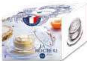
Beurrier Versailles (1 coupelle et 1 cloche)

6402 01 H : 6,5 cm / ø : 9,5 cm Cl : 7 / Oz : 2,47 1155