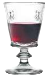
Verre à dégustation

6371 01 H : 16 cm / ø : 9,5 cm Cl : 35 / Oz : 12,3 6 504