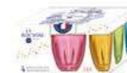
Set 4 Gobelets assortis 6144 96S4 25 Cl