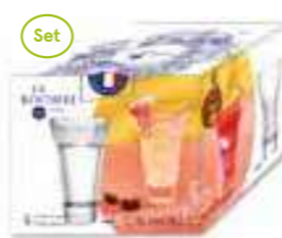
NEW Calanques set de 4 Verres à pastis

6336 01 H : 12,75 cm / ø : 9 cm Cl : 37 / Oz : 10,6 4 768