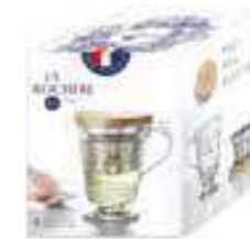
Tisanière Versailles (1 mug, 1 filtre à thé/infuser et 1 couvercle/solid wood lid)

6422 01 H : 11,5 cm / ø : 8,5 cm Cl : 27 / Oz : 9,52 504