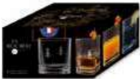
Gobelet à whisky

6474 01 H : 9,4 cm ø : 8,1 cm Cl : 32 / Oz : 11,3 4 1248