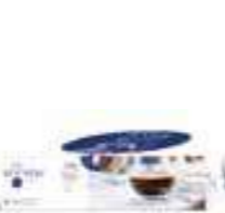
Tasse espresso Design La Racine

6435 01 H : 5,5 cm ø : 7,3 cm Cl : 10 / Oz : 3,53 6 1890