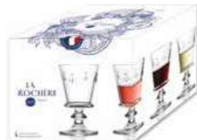
Set de 4 verres à vin

6085 01 H : 16,5 cm / ø : 6,7 cm Cl : 15 / Oz : 5,3 6 798