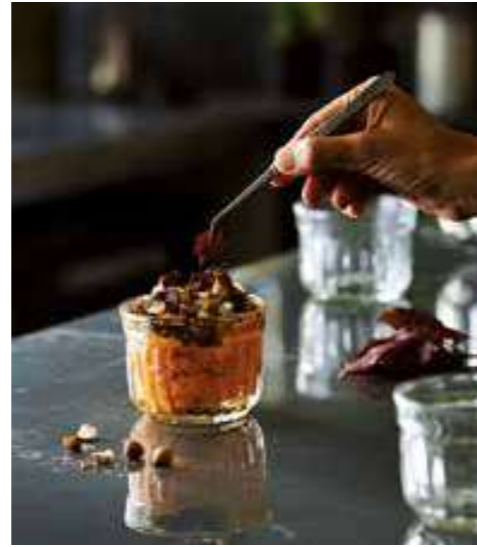
set 2 Délice avec couvercle en liège p 62 set 2 Delice with cork lid - p 62

6420 01 H : 7,3 cm / ø : 9,65 cm Cl : 29 / Oz : 10,23 6 1536