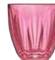
Gobelet framboise 6144 47 25 Cl