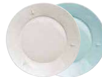
Assiette de service céramique écru (packed by 4 pcs) 5982 20