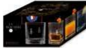
NEW Gobelets à whisky ABEILLE

6427 01 H : 9 cm / ø : 8,6 cm Cl : 30 / Oz : 10,58 420