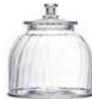
Bocal moyen modèle vénitien fin 4585 01VF H : 16,5 cm / ø : 21 cm Cl : 385 / Oz : 135,8