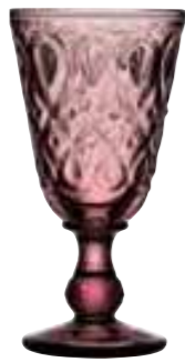
Verre à vin améthyste*

6317 01 H : 16,5 cm / ø : 8,5 cm Cl : 23 / Oz : 8,1 6 672