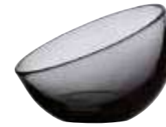
Coupe anthracite* 6178 10 H : 9 cm / ø : 12 cm Cl : 13 / Oz : 4,6 6 6 810