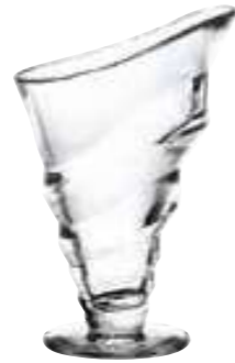
Circée haute 6239 01 H : 16,9 cm ø : 11,5 cm Cl : 27 / Oz : 9,52 6 6 504