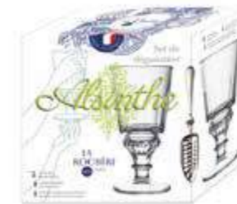
Set de dégustation

2 verres, 1 cuillère + 1 livret de cocktails