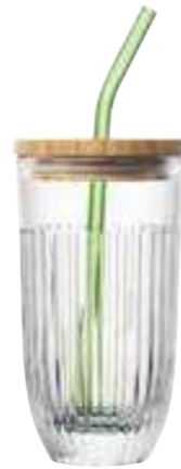
Set Verre à smoothies

avec 1 long drink, 1 couvercle en bambou, 1 paille en verre verte + brosse de nettoyage