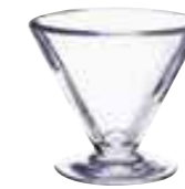
Coupe 6179 01 H : 7,8 cm Cl : 15 / Oz : 5,3 6 6 1080