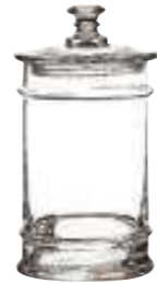
0,5l 4161 01 H : 22 cm / ø : 10,5 cm Cl : 50 / Oz : 17,6