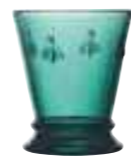
Gobelet Emeraude* 6121 03