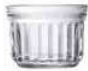
Verrine petit modèle

6423 01 H : 5,3 cm ø : 7,03 cm Cl : 10 / Oz : 3,53 6 3000