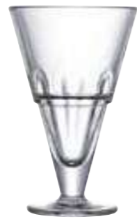
Excelsior haute 6418 01 H : 16,6 cm ø : 10,4 cm Cl : 39 / Oz : 13,76 6 6 504