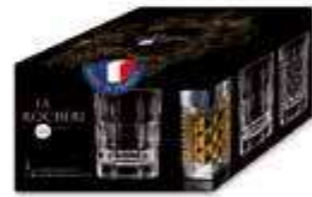
Set de 4 Shooters 2 diamant + 2 taille pointe

6461 01 H : 6,5 cm / ø : 5,1 cm Cl : 4 / Oz : 1,41 6 3360