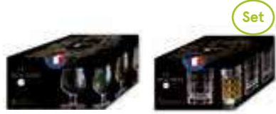
Déguster 2 cl