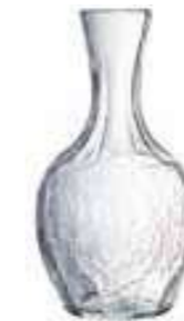
45/50 cl 5117 01 H : 18 cm Oz : 16