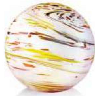
Luminaire MAGNOLIA grand format 1 4141 16 H : 30 cm Fil blanc Lampe E14 5W MAX