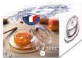
Beurrier Abeille (1 coupelle et 1 cloche)

6402 01 H : 6,5 cm / ø : 9,5 cm Cl : 7 / Oz : 2,47 1155