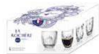
Set 4 tasses 4 motifs différents

6376 01 H : 6,3 cm / ø : 6,2 cm Cl : 10 / Oz : 3,53 6 2784