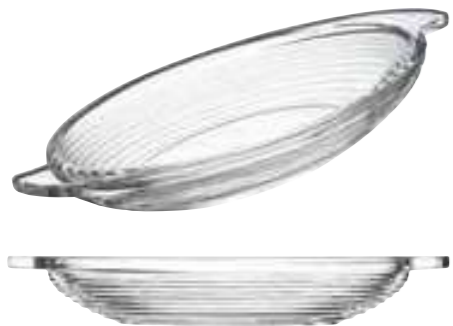
Banana split Bali 2

6102 01 H : 3,9 cm / ø : 25,5 cm Cl : 30 / Oz : 10,6 6 918