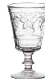
Verre à vin

6124 01 H : 14 cm / ø : 8,5 cm Cl : 34 / Oz : 11,99 6 768