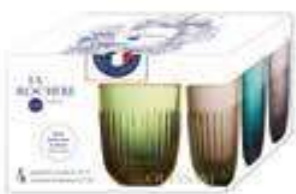
Set de 4 gobelets couleurs assorties*

6338 96S4 H : 9,5 cm / ø : 8 cm Cl : 26 / Oz : 9,17 6 364