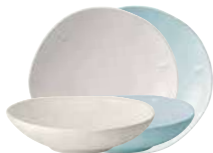
Assiette à pâtes écru ou bleu

5974 20/63 H : 11 cm ø : 10 cm Cl : 52 / Oz : 17,5 (packed by 2 pcs)