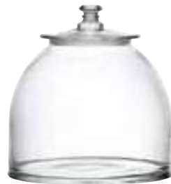
Bocal grand modèle 4587 01 H : 22,5 cm / ø : 27 cm Cl : 900 / Oz : 317,46