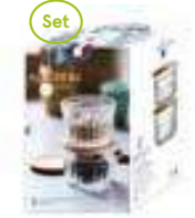
Set de 2 Délice grand modèle couvercle liège verre trempé/tempered glass Design La Racine

6403 01 H : 6,5 cm ø : 9,5 cm Cl : 7 / Oz : 2,47 1155