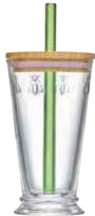
Set Bubble tea

6474 01 H : 9,4 cm ø : 8,1 cm Cl : 32 / Oz : 11,3 4 1248