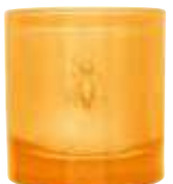
Fleur d'Orient Prune, cuir, notes solaires, santal Plum, leather, solar notes, santalwood

6449 38 H : 9,4 cm / ø : 8,1 cm packed by 1