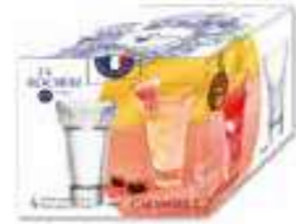
Set de 4 verres

6463 01 H : 13,4 cm ø : 8,1 cm Cl : 22 / Oz : 7,76 6.90LR2.80 6 768