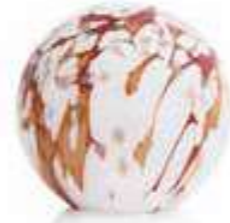
Luminaire Savane 1 4481 21 H : 21,5 cm / ø : 23 cm Fil blanc Lampe E14 5W MAX