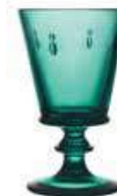
Verre à vin*

6110 03 H : 14,1 cm / ø : 8,5 cm Cl : 24 / Oz : 8,5 6 768