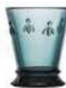
Gobelet Bleu nuit* 6121 48