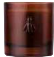
Envolée dans les dunes Orange Blossom Amandes, fleur d'oranger, musc

6449 02 H : 9,4 cm ø : 8,1 cm packed by 1