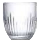
Gobelet jeux d'orgues

6406 01 H : 8,2 cm / ø : 7,8 cm Cl : 23 / Oz : 8,11 6 1152