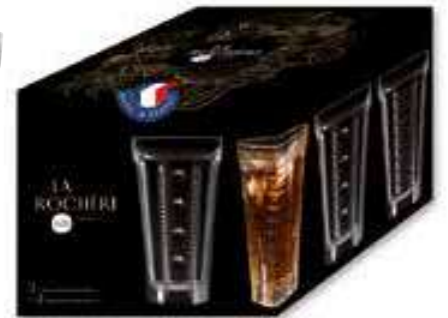
Set de 4 long drink 2 amande + 2 perles

6393 01 H : 14,5 cm ø : 8,44 cm Cl : 34,8 Oz : 12,28 1 768