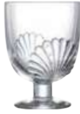
Verre à pied

6411 01 H : 11,4 cm / ø : 8,3 cm Cl : 29 / Oz : 8,82 6 1140