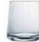
Gobelet vénitien fin

4153 01VF H : 27 cm ø : 10,1 cm Cl : 100 Oz : 35,27