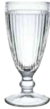
Antillaise 6029 01 H : 18,4 cm / ø : 12 cm Cl : 29 / Oz : 10,2 6 6 504