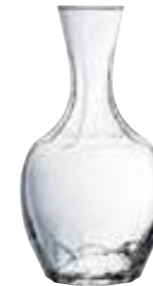
45/50 cl 5116 01 H : 18 cm Oz : 16