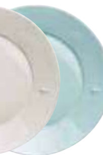
Assiette de service céramique bleu (packed by 4 pcs) 5982 63