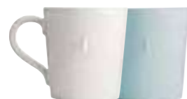
Mug écru ou bleu

5973 20/63 H : 9,3 cm ø : 8 cm Cl : 20 / Oz : 6 (packed by 1 pc)