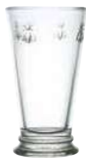
Maxi long drink

6371 01 H : 16 cm / ø : 9,5 cm Cl : 35 / Oz : 12,3 6 504