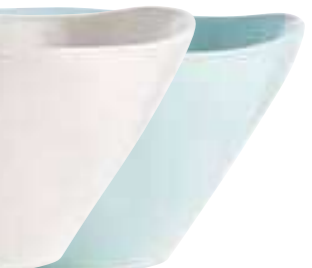
Saladier céramique bleu (packed by 1 pc) 5980 63 330 Cl