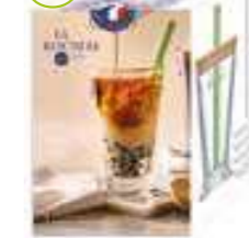
NEW Set Bubble tea 1 long drink, 1 paille en verre verte, 1 couvercle en bambou et 1 brosse de nettoyage

6446 01 H : 11,5 cm / ø : 8,5 cm Cl : 27 / Oz : 9,52 504