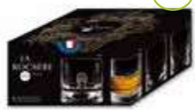
Set de 4 gobelets à whisky DANDY

6163 01 H : 7,47 cm / ø : 8,05 cm Cl : 16 / Oz : 5,65 4 1140