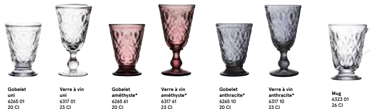
Gobelet uni 6265 01 20 Cl