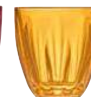
Gobelet mandarine 6144 36 25 Cl