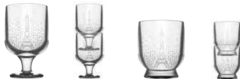
Verre à pied²

6437 01 H : 12,5 cm / ø : 7,5 cm Cl : 25 / Oz : 8,82 6 960