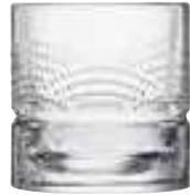
Verre à whisky Kaïto

6428 01 H : 9 cm / ø : 8,6 cm Cl : 30 / Oz : 10,58 4 1368