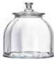
Bocal moyen modèle vénitien large 4585 01VL H : 16,5 cm / ø : 21 cm Cl : 385 / Oz : 135,8