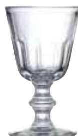
Verre à vin

6351 01 H : 10,5 cm / ø : 8,5 cm Cl : 23 / Oz : 8,11 6 1152