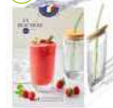
NEW Set verre à smoothies 1 long drink, 1 paille en verre verte, 1 couvercle en bambou et 1 brosse de nettoyage

6473 01 (Set) H : 16 cm ø : 9 cm Cl : 46 / Oz : 16,23 378