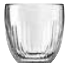
Tasse espresso jeux d'orgues

6373 01 H : 6,3 cm / ø : 6,2 cm Cl : 10 / Oz : 3,53 6 2784