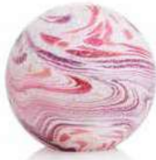
Luminaire MANDALA grand format 1 4141 11 H : 30 cm Fil blanc Lampe E14 5W MAX