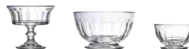
Coupe 2 6277 01 22 Cl