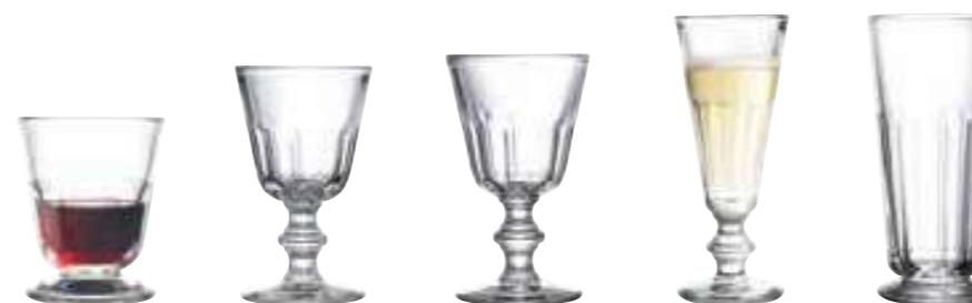
Gobelet 6351 01 23 Cl