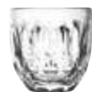
Tasse espresso facettes

6373 01 H : 6,3 cm / ø : 6,2 cm Cl : 10 / Oz : 3,53 6 2784