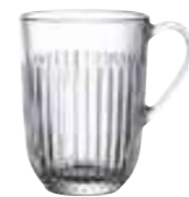
Mug 6313 01 36 Cl