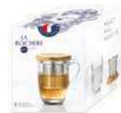
Tisanière 6404 01 36 Cl