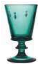
Verre à vin Emeraude* 6110 03