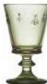
Verre à vin*

6110 97 H : 14,1 cm / ø : 8,5 cm Cl : 24 / Oz : 8,5 6 768