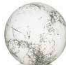
Luminaire globe 1 4481 62 H : 21,5 cm / ø : 23 cm Fil blanc Lampe E14 5W MAX