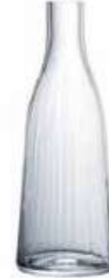
Carafe vénitien fin

4088 01 H : 9,2 cm ø : 8,1 cm Cl : 30 Oz : 10,58