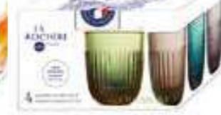
NEW Ouessant Set de 4 gobelets couleurs

6338 01S4 H : 8,2 cm / ø : 7,8 cm Cl : 23 / Oz : 8,11 1248