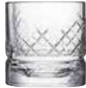
Verre à whisky Glen

6428 01 H : 9 cm / ø : 8,6 cm Cl : 30 / Oz : 10,58 4 1368