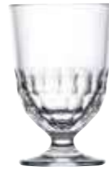
Verre grand modèle

6132 01 H : 15,3 cm / ø : 8 cm Cl : 38 / Oz : 13,4 6 912