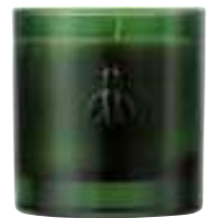
Envolée en Méditerranée Cedar Cèdre et cyprès

6449 14 H : 9,4 cm ø : 8,1 cm packed by 1