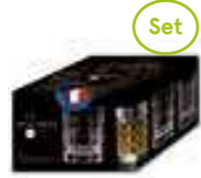
After Set de 4 Shooter 2 motifs différents

6459 01 H : 6,5 cm / ø : 5,1 cm Cl : 4 / Oz : 1,41 1080