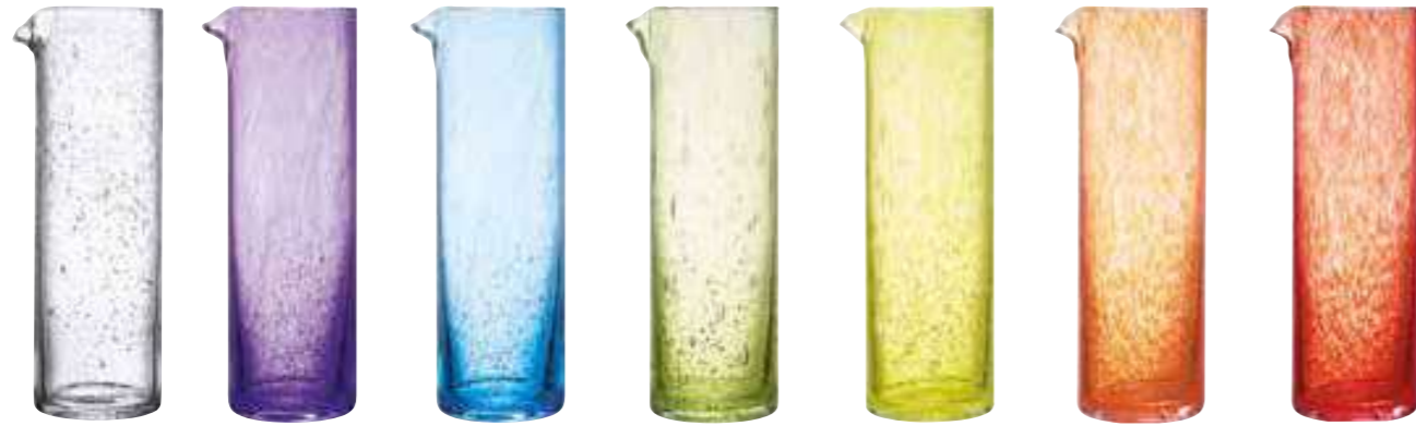
Broc uni violet* bleu azur* vert* jaune* orange* rouge* 5286 01 H : 26,4 cm ø : 8,4 cm Cl : 100 Oz : 35,27 5286 08 H : 26,4 cm ø : 8,4 cm Cl : 100 Oz : 35,27 5286 32 H : 26,4 cm ø : 8,4 cm Cl : 100 Oz : 35,27 5286 14 H : 26,4 cm ø : 8,4 cm Cl : 100 Oz : 35,27 5286 38 H : 26,4 cm ø : 8,4 cm Cl : 100 Oz : 35,27 5286 36 H : 26,4 cm ø : 8,4 cm Cl : 100 Oz : 35,27 5286 25 H : 26,4 cm ø : 8,4 cm Cl : 100 Oz : 35,27