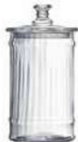
Bocal 1l vénitien fin 4162 01VF H : 24,5 cm / ø : 11,5 cm Cl : 100 / Oz : 35,3