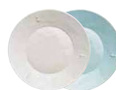
Assiette à dessert céramique écru (packed by 4 pcs) 5981 20