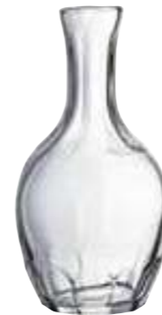
75 cl 5142 01 H : 22 cm Oz : 26,5