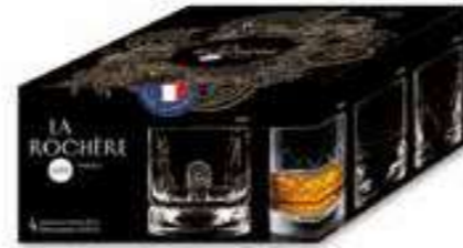
Set de 4 verres à whisky

6431 01 H : 9 cm / ø : 8,6 cm Cl : 30 / Oz : 10,58 6 1368