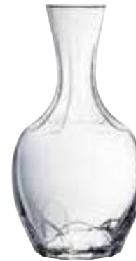
Carafe 100 cl 5144 01 H : 23,5 cm Oz : 35,3