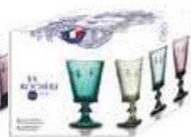
Set de 4 verres à vin 4 couleurs assorties 6110 9654