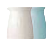
Crémier céramique écru ou bleu (packed by 1 pc) 5973 20/63 20 Cl