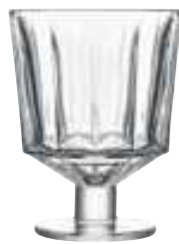
Verre à pied

6386 01 H : 11,4 cm / ø : 8,6 cm Cl : 26 / Oz : 9,17 6 1440