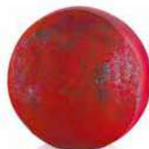
Luminaire ALBATRE grand format rouge 1 4141 09 H : 30 cm Fil noir Lampe E14 5W MAX