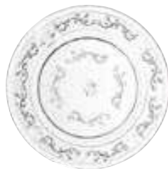
Assiette à dessert