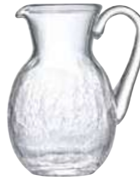
Broc à anse transparent

5293 01 H : 21,3 cm ø : 16 cm Cl : 150 Oz : 52,9