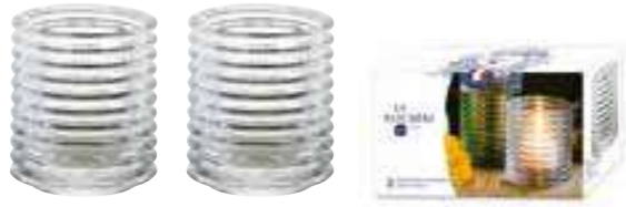
Set 2 Photophores transparents

6242 01B H : 7,8 cm / ø : 6,7 cm 13.90LR5.50 864