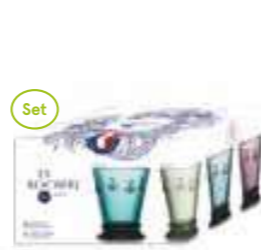
Set de 4 gobelets couleurs assorties

6110 96S4 H : 14,1 cm / ø : 8,5 cm Cl : 24 / Oz : 8,5 192