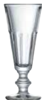
Flûte à champagne

6209 01 H : 14,5 cm / ø : 8,7 cm Cl : 22 / Oz : 7,8 6 672