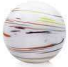
Luminaire globe 1 4481 16 H : 21,5 cm / ø : 23 cm Fil blanc Lampe E14 5W MAX