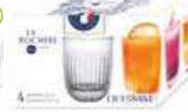
NEW Ouessant Set de 4 gobelets unis

6415 01 H : 8,2 cm / ø : 7,8 cm Cl : 23 / Oz : 8,11 364