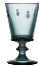
Verre à vin Bleu nuit* 6110 48