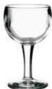
Verre à eau

6257 01 H : 13,4 cm / ø : 7,5 cm Cl : 14 / Oz : 4,9 6 768