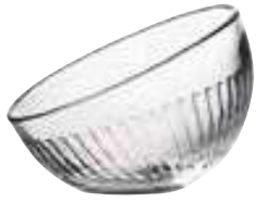
Coupe 6416 01 H : 9 cm / ø : 12 cm Cl : 13 / Oz : 4,6 6 6 810