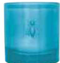
Fleur d'Azur Jasmin, agrumes, rose Jasmins, citrus, rose

6449 18 H : 9,4 cm / ø : 8,1 cm packed by 1