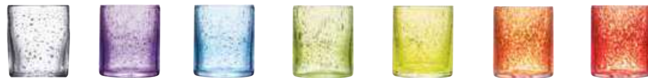
Gobelet whisky uni violet* bleu azur* vert* jaune* orange* rouge* 5287 01 H : 9,8 cm ø : 8 cm Cl : 35 / Oz : 12,35 5287 08 H : 9,8 cm ø : 8 cm Cl : 35 Oz : 12,35 5287 32 H : 9,8 cm ø : 8 cm Cl : 35 Oz : 12,35 5287 14 H : 9,8 cm ø : 8 cm Cl : 35 Oz : 12,35 5287 38 H : 9,8 cm ø : 8 cm Cl : 35 Oz : 12,35 5287 36 H : 9,8 cm ø : 8 cm Cl : 35 Oz : 12,35 5287 25 H : 9,8 cm ø : 8 cm Cl : 35 Oz : 12,35