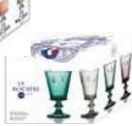
Set de 4 verres à vin couleurs assorties

6121 90S4 H : 10,3 / ø : 8,4 cm Cl : 26 / Oz : 9,2 240