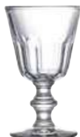
Verre à eau

6210 01 H : 14 cm / ø : 8 cm Cl : 19 / Oz : 6,7 6 768