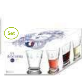
Set de 4 gobelets

6110 01S4 H : 14,1 cm / ø : 8,5 cm Cl : 24 / Oz : 8,5 192