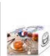
Abeille (1 coupelle, 1 cloche)

6402 01 H : 6,5 cm ø : 9,5 cm Cl : 7 / Oz : 2,47 1155