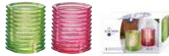
Set 2 Photophores vert et rose

6242 01B H : 7,8 cm / ø : 6,7 cm 13.90LR5.50 864