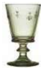
Verre à vin olive* 6110 97