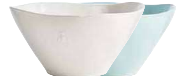
Saladier céramique écru (packed by 1 pc) 5980 20 330 Cl