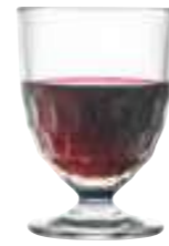
Verre petit modèle

6116 01 H : 12,6 cm / ø : 8,3 cm Cl : 28 / Oz : 9,88 6 912