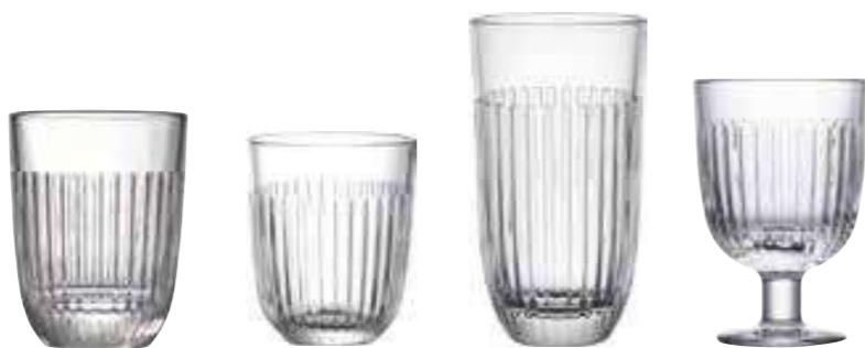
Grand gobelet uni

6471 01 H : 11 cm ø : 8,5 cm Cl : 34 / Oz : 12 6 1140