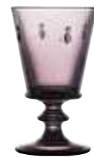
Verre à vin Aubergine* 6110 08