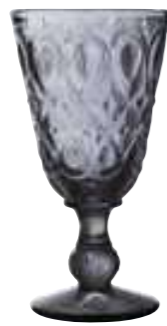
Verre à vin anthracite*

6317 61 H : 16,5 cm / ø : 8,5 cm Cl : 23 / Oz : 8,1 6 672