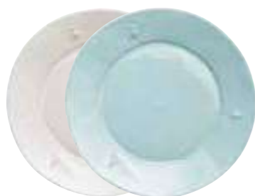
Assiette de service écru