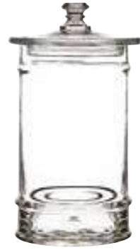
3l 4164 01 H : 30,5 cm / ø : 14,5 cm Cl : 300 / Oz : 105,8