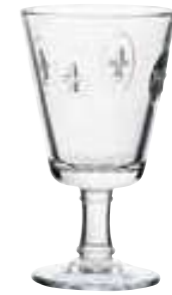
Verre à vin

6291 01 H : 10,3 cm / ø : 8,7 cm Cl : 25 / Oz : 8,8 6 1152