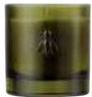
Envolée dans le verger Fig Figue

6449 97 H : 9,4 cm ø : 8,1 cm packed by 1