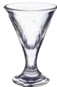
Fidji 6040 01 H : 15,3 cm / ø : 10 cm Cl : 20 / Oz : 7 6 6 576