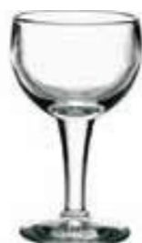
Verre à vin rouge

6257 01 H : 13,4 cm / ø : 7,5 cm Cl : 14 / Oz : 4,9 6 768