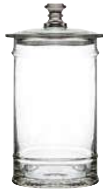
Bocal 4l 4165 01 H : 33,5 cm / ø : 16 cm Cl : 400 / Oz : 141,1