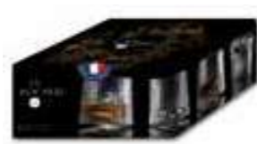
Blossom Gobelet à whisky Design J.François D'Or

6459 01 H : 6,5 cm / ø : 5,1 cm Cl : 4 / Oz : 1,41 1080