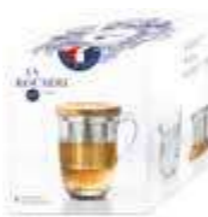
Tisanière Ouessant (1 mug, 1 filtre à thé et 1 couvercle)

6404 01 H : 11,7 cm / ø : 8,5 cm Cl : 36 / Oz : 12,7 540