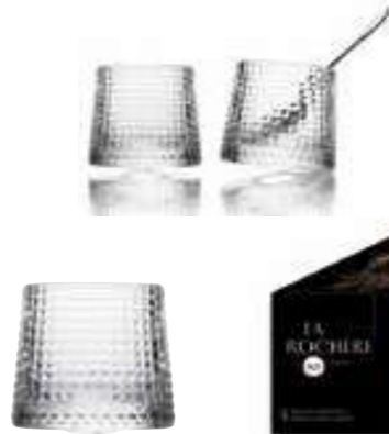
Verre à whisky

6163 01 H : 7,47 cm / ø : 8,05 cm Cl : 16 / Oz : 5,65 4 1140