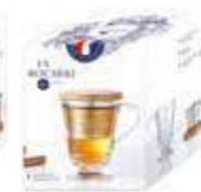
Tisanière Abeille (1 mug, 1 filtre à thé/infuser et 1 couvercle/solid wood lid)

6404 01 H : 11,7 cm / ø : 8,5 cm Cl : 36 / Oz : 12,7 540