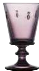
Verre à vin*

6110 08 H : 14,1 cm / ø : 8,5 cm Cl : 24 / Oz : 8,5 6 768