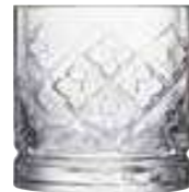
Verre à whisky Patrick

6430 01 H : 9 cm / ø : 8,6 cm Cl : 30 / Oz : 10,58 6 1368